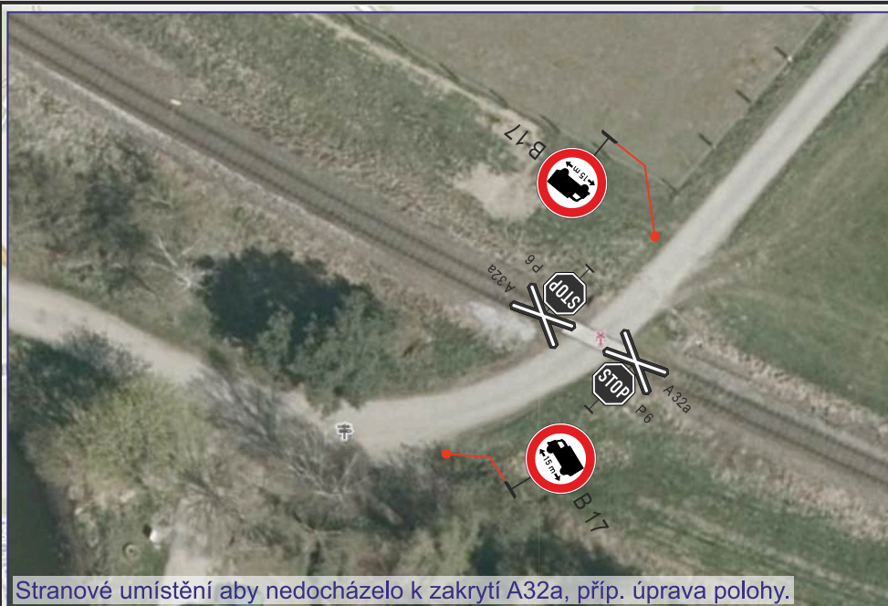
Stranové umístění aby nedocházelo k zakrytí A32a, příp. úprava polohy.